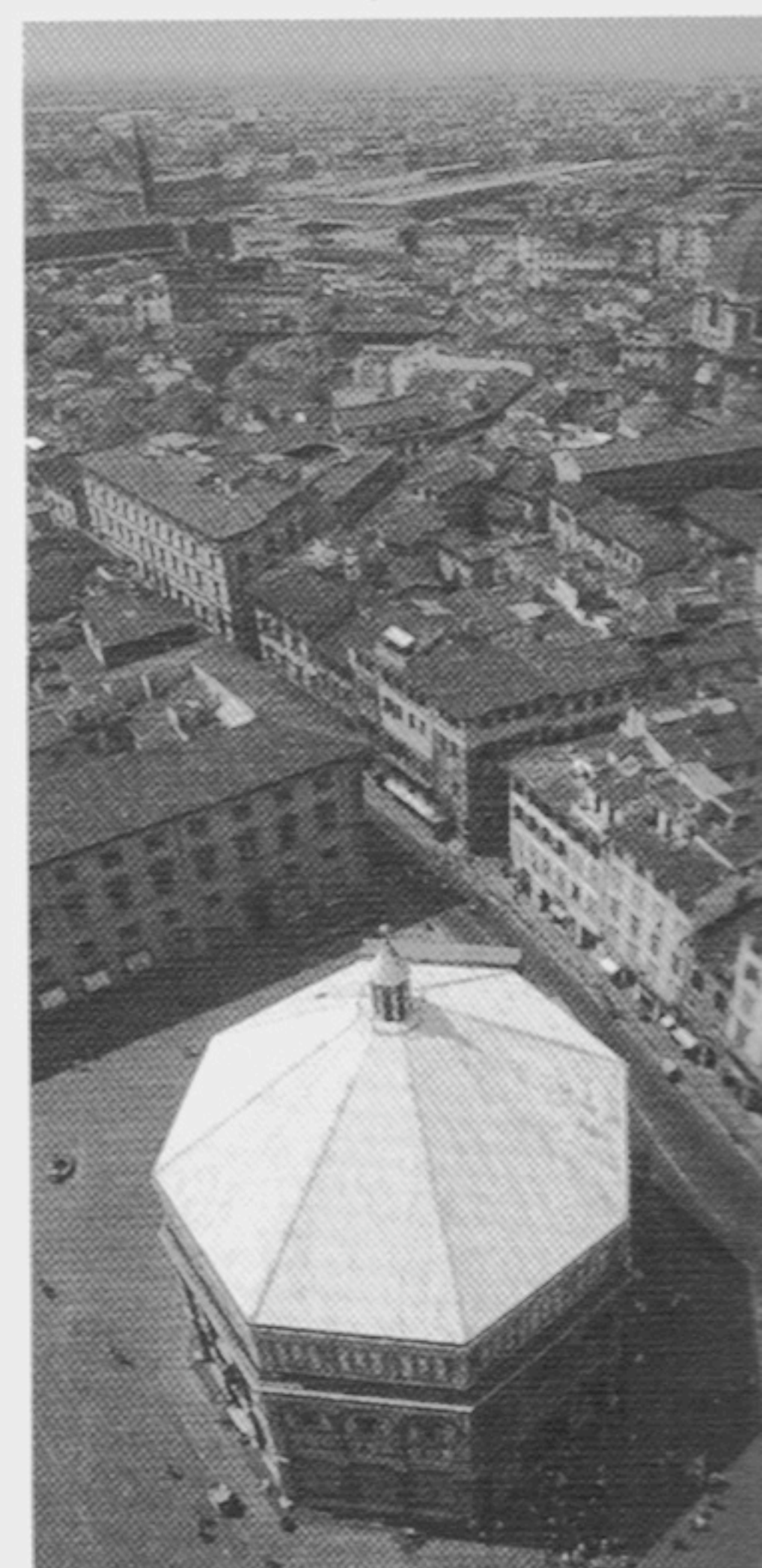
Vista general de Florencia.

Amplía los contenidos de esta edad con tu CD-ROM.